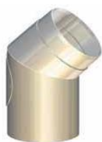
Koleno 45° s revíznym otvorom