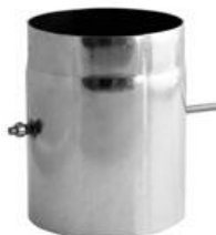
Klapka s ovládačom 8x8