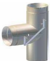
Sopúch s klapkou