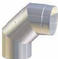
Koleno 90° s revíznym otvorom