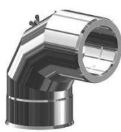
Koleno 90° s revíznym otvorom